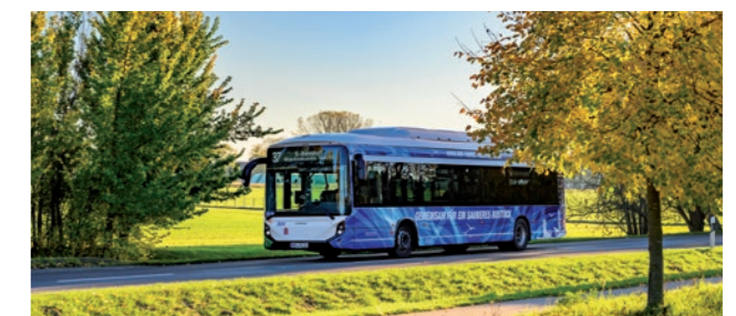
Elektrobus der Firma RSAG

Einwohner und Besucher haben somit eine Vielzahl von Möglichkeiten, sich innerhalb der Region problemlos fortzubewegen. Ganz gleich, ob per Auto, Bahn oder Fähre - in Rostock ist Mobilität bestens gewährleistet.