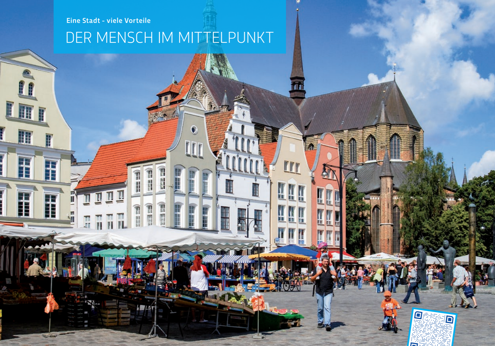
Der Neue Markt im Zentrum von Rostock