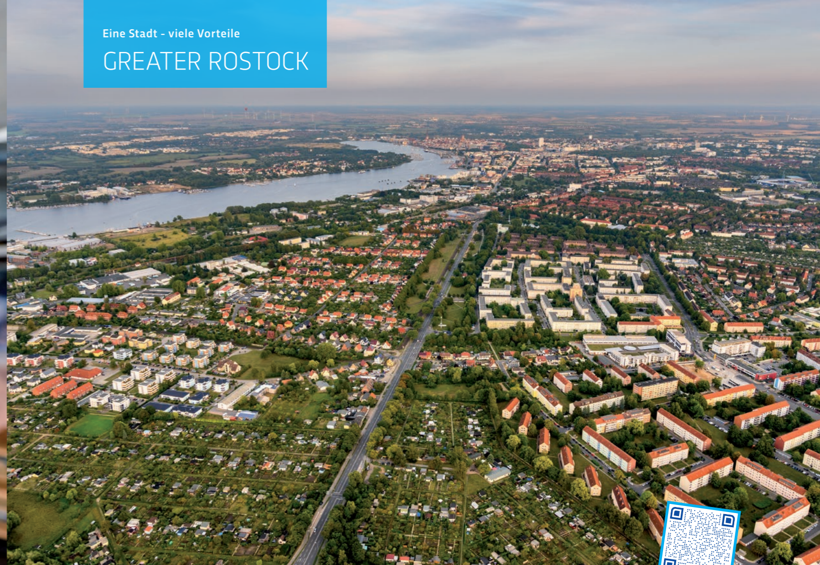
Weitblick von Rostock in die Region

Darüber hinaus bietet Rostock ein breites Angebot an Coworking Spaces wie das Basislager, @Work Office Spaces, Technologie Zentrum Warnemünde und die Orangery.