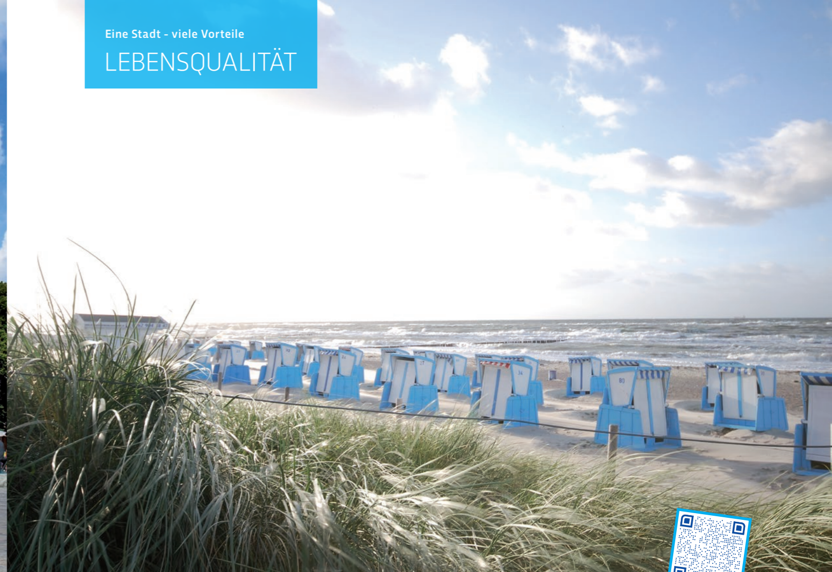
Strandkörbe an der Ostsee

Das Welcome Center Region Rostock bietet eine kostenfreie, individuelle Beratung zu allen Fragen rund um das Ankommen und Heimischwerden in der Region Rostock. Von umfassendem Informationsmaterial, Kontakte zu relevanten Unternehmen bis hin zur Unterstützung bei der Wohnraumsuche steht das Welcome Center mit Rat und Tat zur Seite.