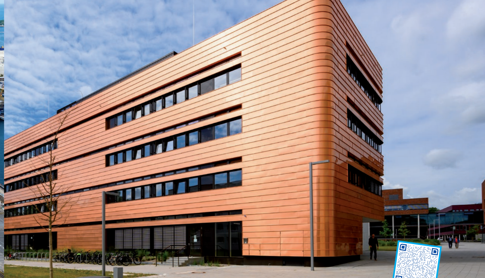
Fakultät für Informatik und Elektrotechnik der Universität Rostock

Mit dieser maximalen Traglast wird der Kran nicht nur für Logistikprozesse rund um die Produktion und Montage von maritimen Kränen der Firma Liebherr genutzt, sondern steht auch externen Unternehmen zur Verladung von Groß- und Schwerlastgütern zur Verfügung.