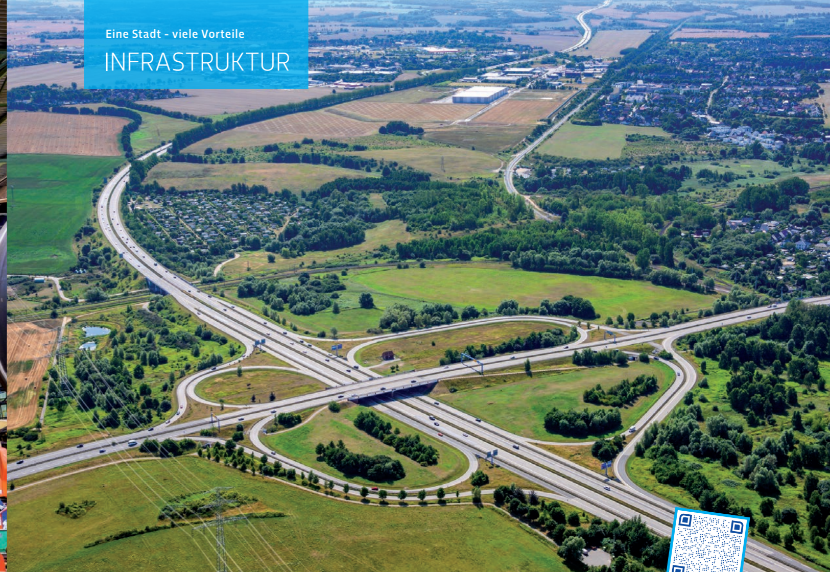
Anschlussstelle Rostock Ost