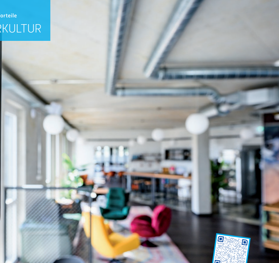
@Work Office Spaces am Werftdreieck in Rostock