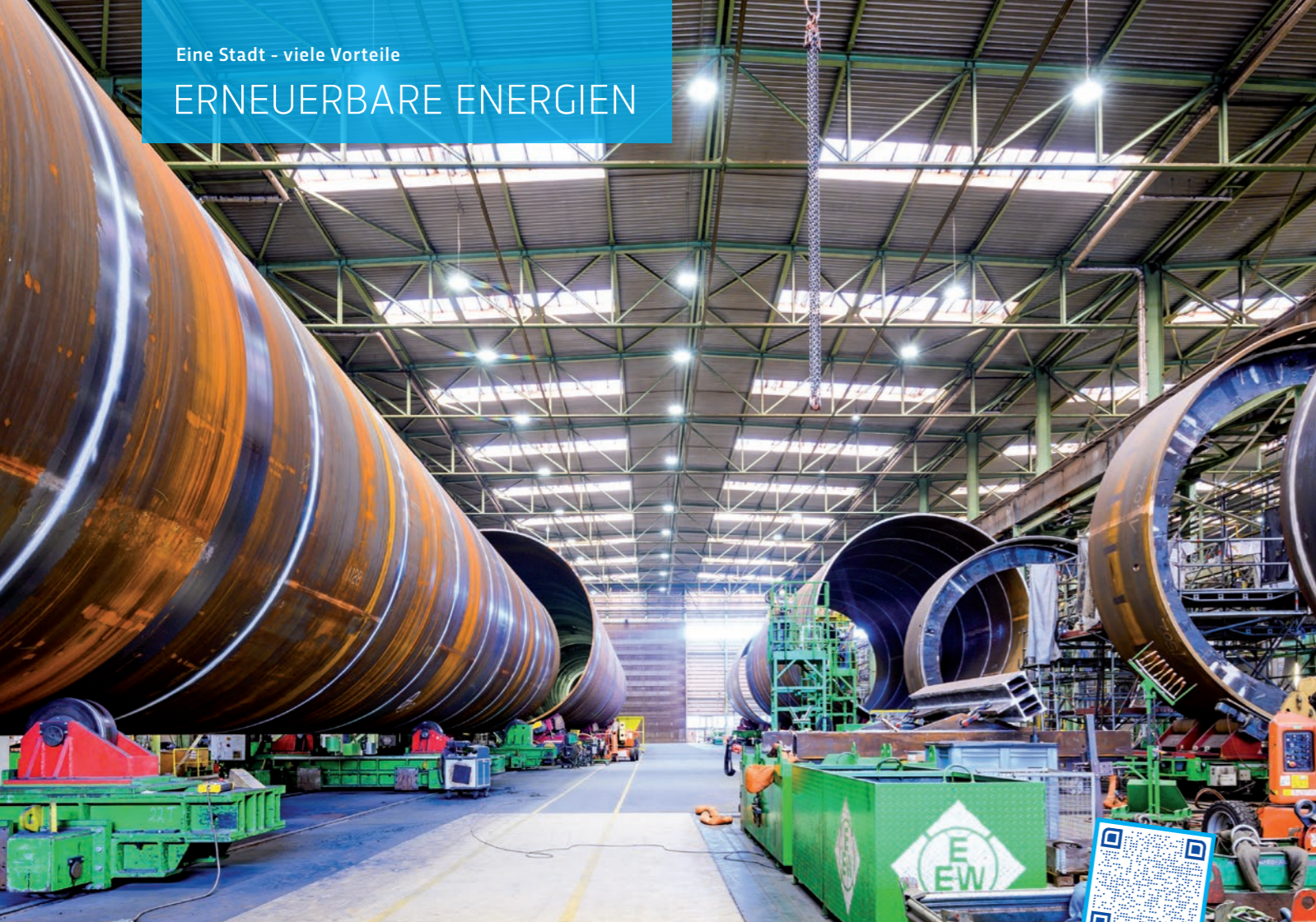
Produktionshalle von EEW Special Pipe Constructions GmbH im Überseehafen Rostock