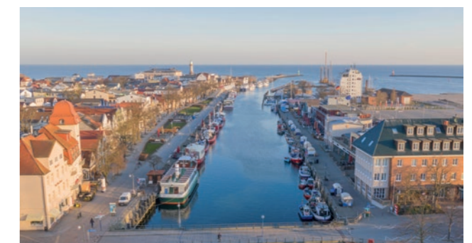
Der alte Strom in Rostock-Warnemünde

eine ausgewogene Work-Life-Balance. Die Stadt bietet vielfältige Arbeitsmöglichkeiten und gute Bildungseinrichtungen für Familien. Hier lässt sich Karriere mit persönlichem Glück vereinen. Die lebendige Stadt und der gesunde Lebensstil bieten ein angenehmes Umfeld für Einwohner und Beschäftigte.